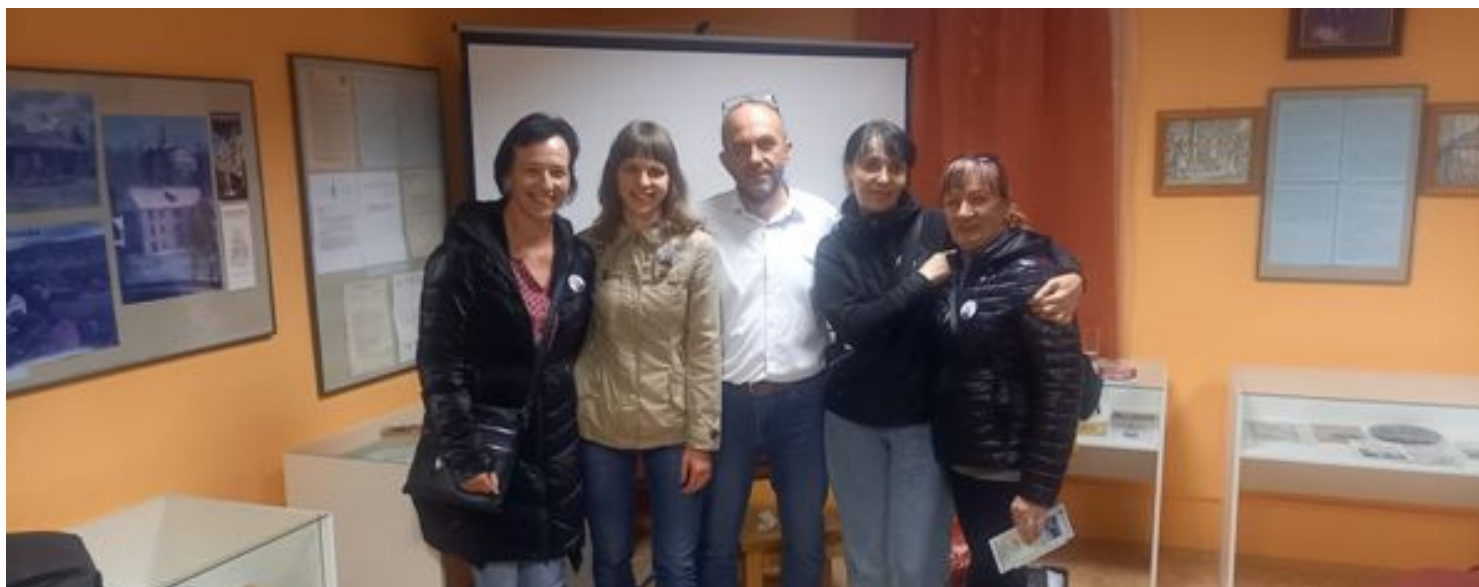
Muzejní noc, 17. května 2024 (nahore), Návštěva Spolku historiků z Herrnhutu, 11. května 2024 (dole)