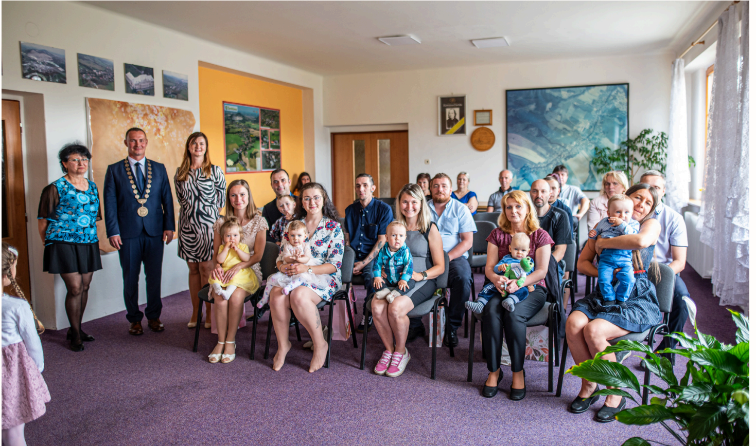
Vítání občánků, červen 2024