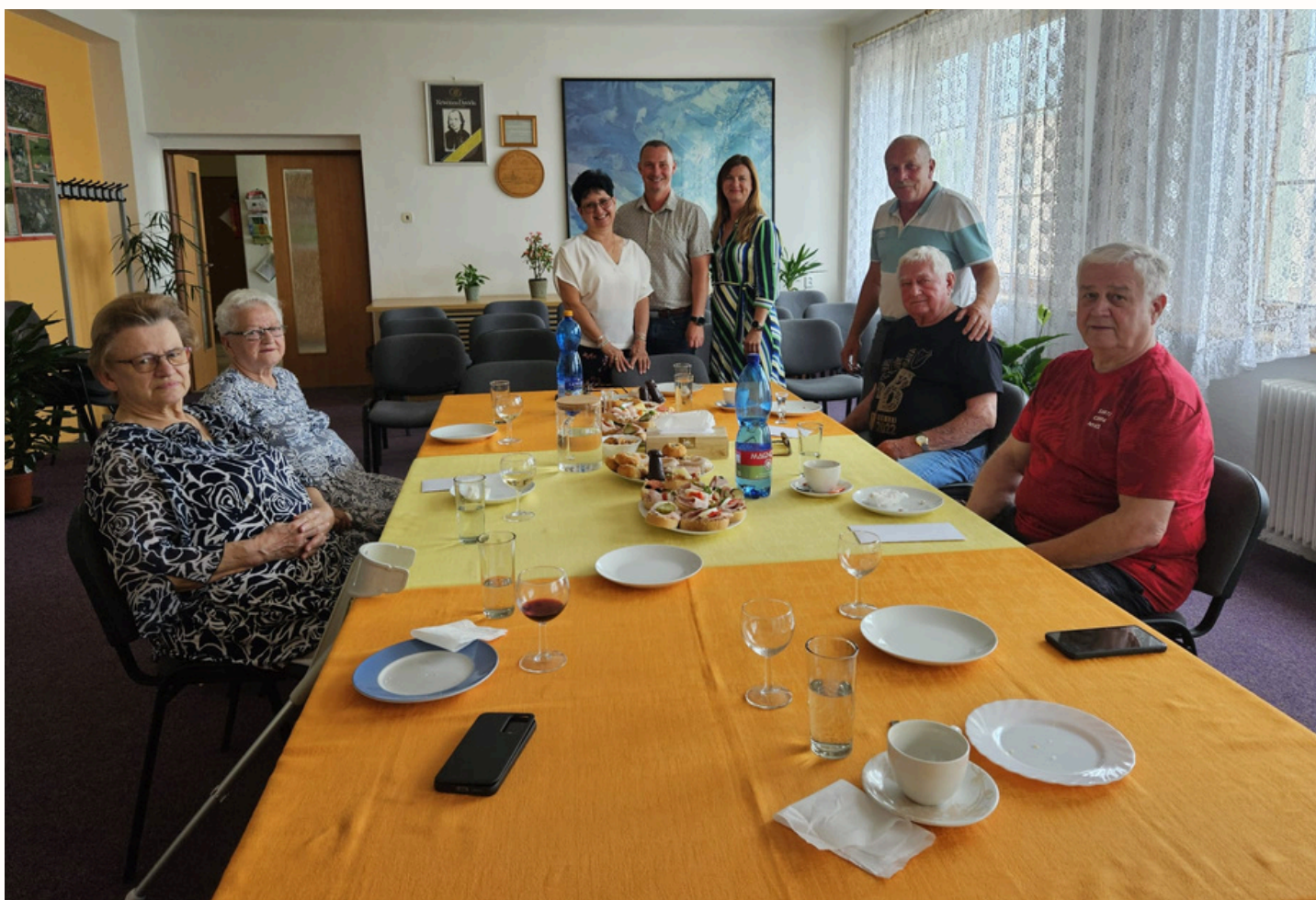
Setkání jubilantů, červen 2024